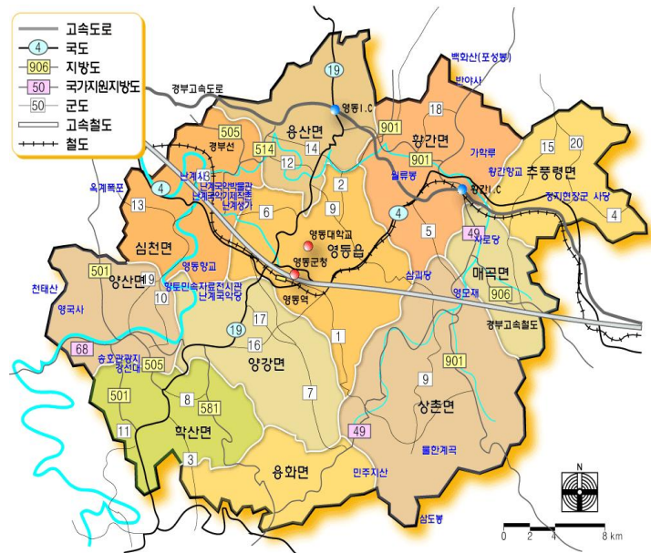
(그림2-4) 지정 장기개발계획의 공간적 범위