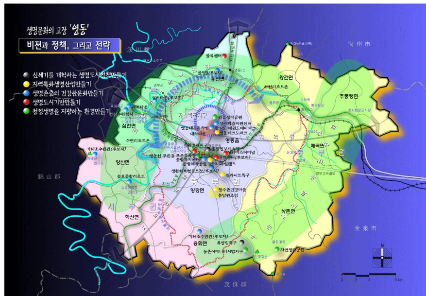
(그림2-3) 기정 장기개발계획의 기본구상도