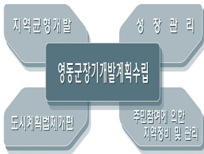
(그림2-1) 기정 계획의 배경