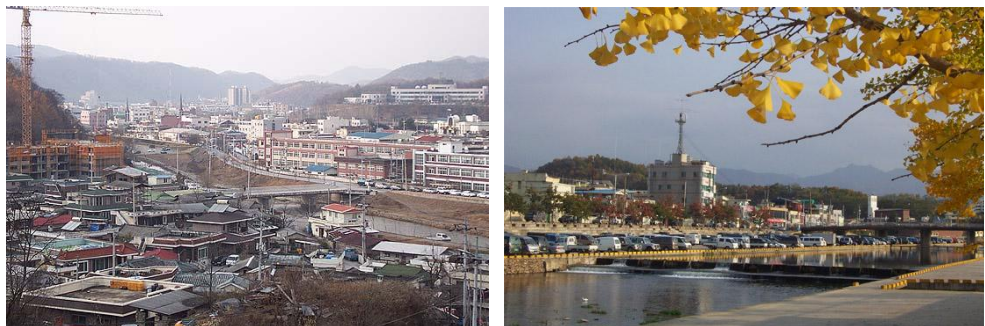
(그림7-1) 영동읍 도시 전경