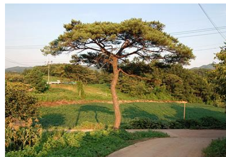
(그림7-2) 영동군 경관 자원