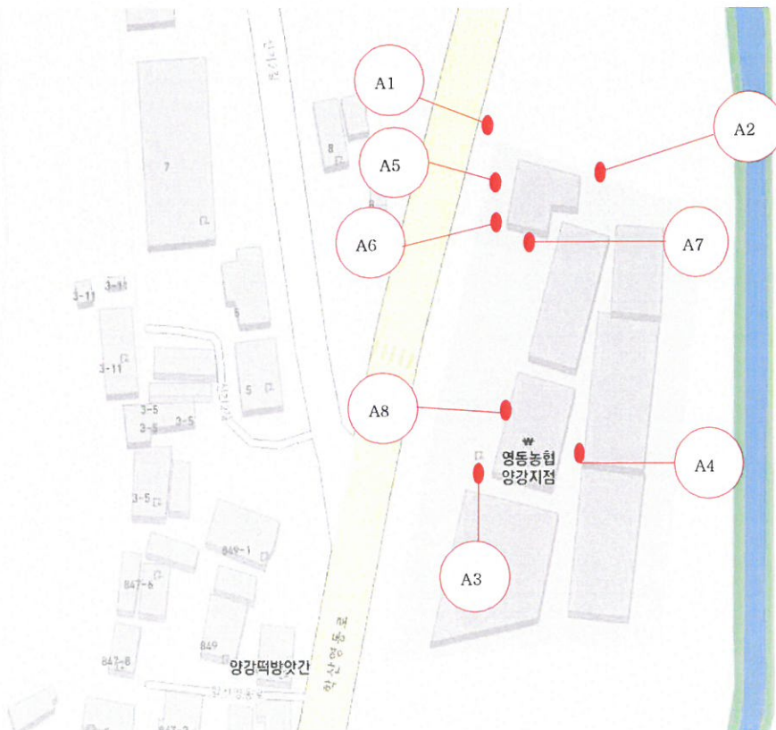
측정 지점 위치(도식도)