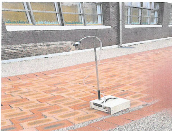
작업장 주변 비산관리를 위한 농도측정 부지경계선