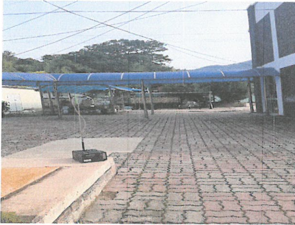
작업장 주변 비산관리를 위한 농도측정 부지경계선