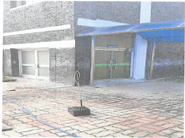
작업장 주변 비산관리를 위한 농도측정 부지경계선