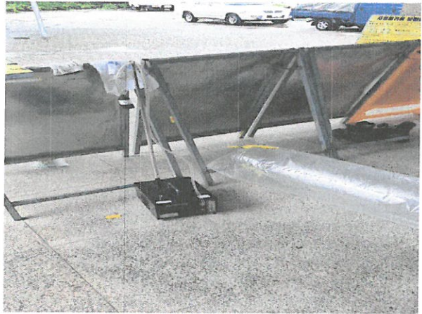
작업장 주변 비산관리를 위한 농도측정 음압기 배출구