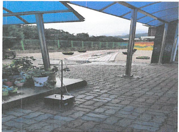
작업장 주변 비산관리를 위한 농도측정 부지경계선