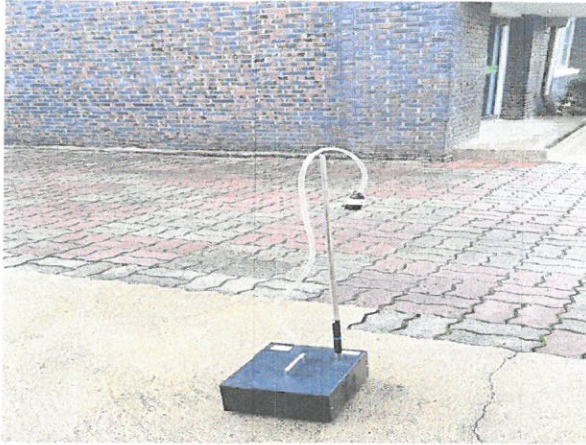
작업장 주변 비산관리를 위한 농도측정 부지경계선