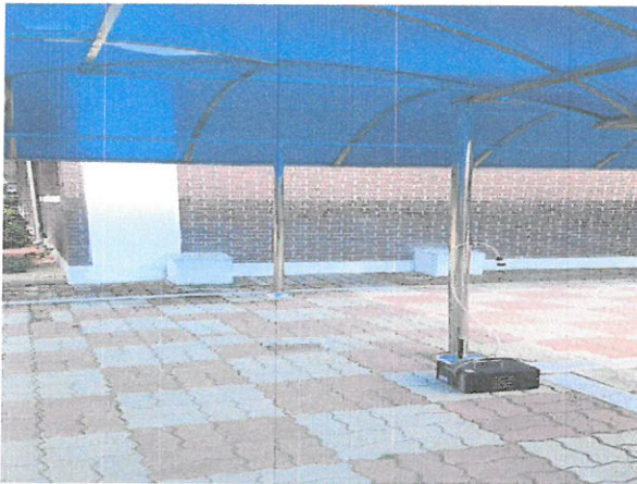
작업장 주변 비산관리를 위한 농도측정 부지경계선