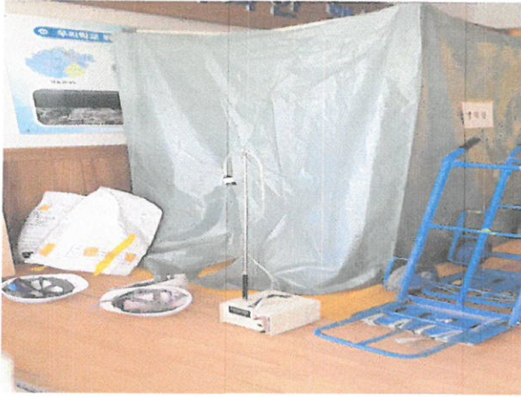
작업장 주변 비산관리를 위한 농도측정 위생설비 입구