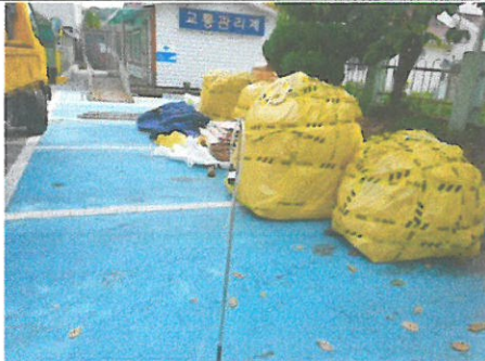
작업장 주변 비산관리를 위한 농도측정 폐기물반출구