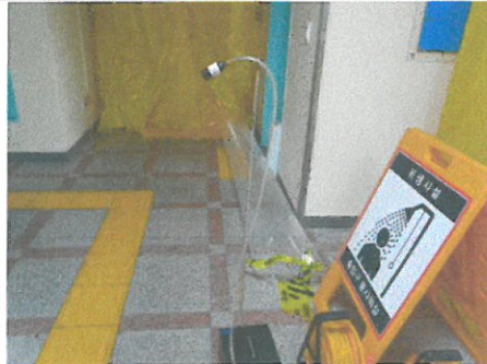
작업장 주변 비산관리를 위한 농도측정 음압기배출구