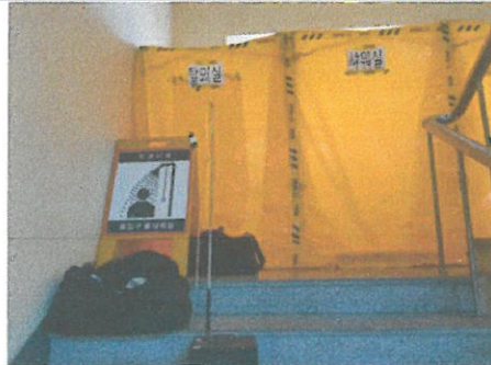
작업장 주변 비산관리를 위한 농도측정 위생설비입구