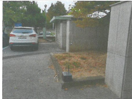
작업장 주변 비산관리를 위한 농도측정 부지경계선