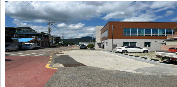
매곡면 노천리 64-52(신설)