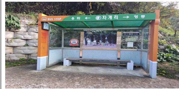
용화면 자계리 745-1, 산60-1(교체)