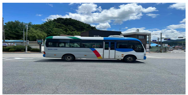
학산면 서산리 897-5(신설)