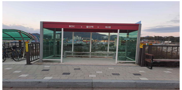
황간면 마산리 46-1(교체)