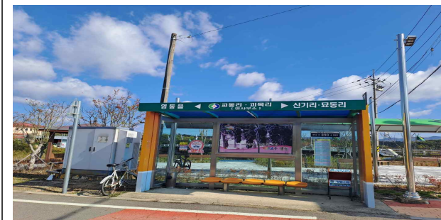
양강면 괴목리 773, 1047-1, 774-2(교체)