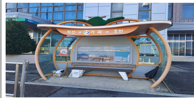
양산면 가곡리 173-4(교체)