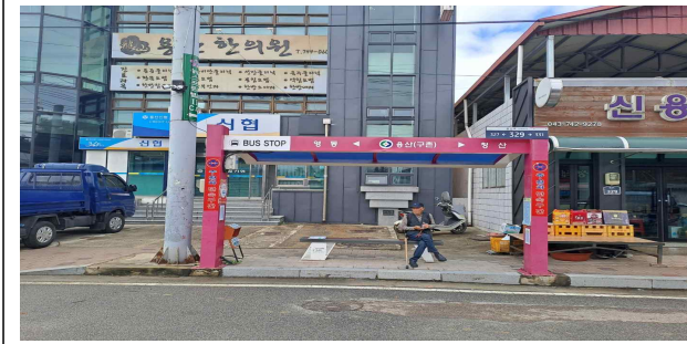
용산면 구촌리 190-21(교체)