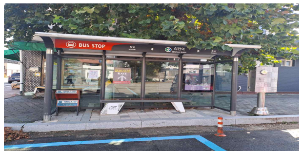
심천면 심천리 195-1(교체)