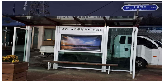
추풍령면 추풍령리 336-41