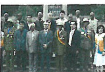
한국전 참전용사회 지원