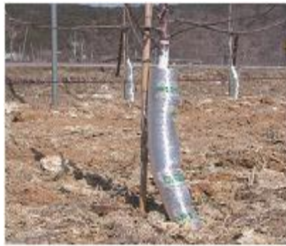
<주간부 보온단열재 피복>