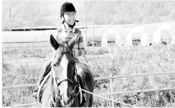
양산초 승마체험 영동 양산초등학교는 31일 송호승마장에서 전교생 89명이 참여한 가운데 동물과 교감기회를 갖기 위해 '승마체험'을 가졌다.