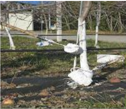
<주간부 수성페인트 도포>