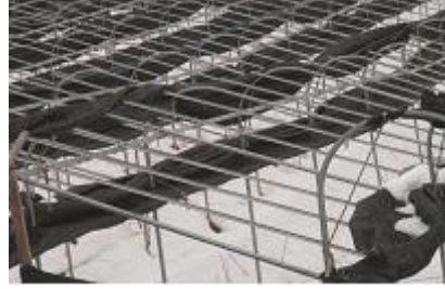
<인삼시설 차광망 제거>