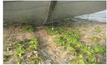
<하우스 붕괴로 시설작물 피해>