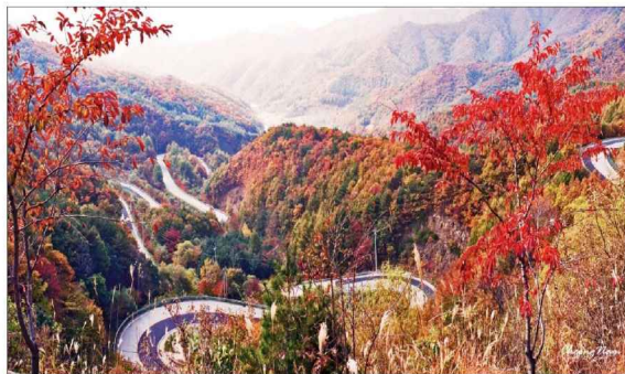
북게 물든 영동 도마령 충북 영동군 상촌면 고지리와 울퉁한 조동리를 잇는 국가지원지방도 48호선에 위치한 고갯길 도마령(刀馬嶺·840m)이 단풍과 어우러져 가을 정취를 느끼고 싶은 관광객들을 유혹하고 있다. 도마령은 지난 2007년 행정안전부가 주관한 살기좋은 지역 만들기 지역자원 경연대회에서 100선에 선정됐다.