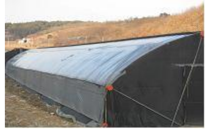
<차광망 위에 비닐을 씌움>