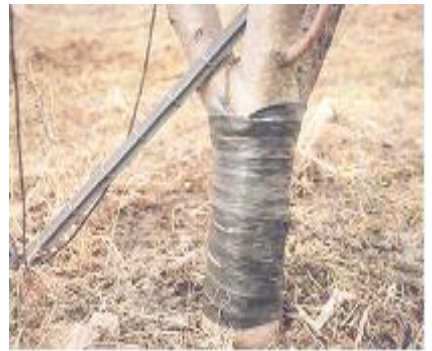
<피해시 과열부위 벤딩처리>