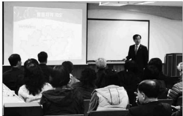
영동교육지원청은 지난달 31일 상촌초 강당에서 상촌 지역 주민들을 대상으로 영동 동부지역 기속형 중학교(가칭) 설립과 관련한 설명회를 개최했다.

대상 설문조사는 오는 5일부터 시작 이후 위치선정에 대한 구체적인 협의가 시작될 예정”이라고 말했다. 이상 찬성할 경우 설립이 확정되며, 영동-배은식 기자 dkeka23@ccotoday.co.kr