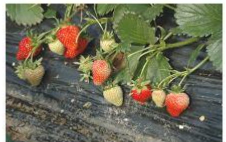
<기형과 발생 및 병해충 증가>