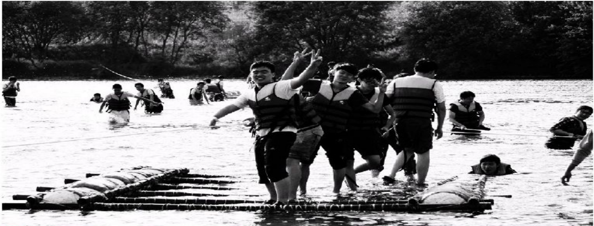
영동군 양강면 '비단강숲마을' 금강에서 청소년들이 뗏목타기 체험을 즐기고 있다.