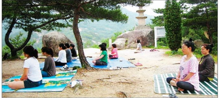
충북 영동군 양산면의 천년고찰 영국사 은행나무(왼쪽)를 주제로 한 이색적인 '생명 스테이' 행사가 올 11월까지 열린다.