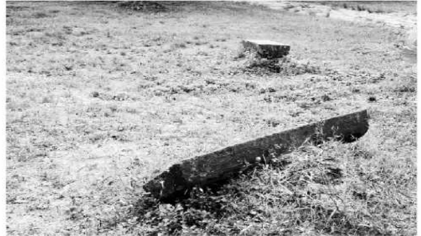
지난 5일 영동 송호국민관광지 수도가에 음식물쓰레기가 바구니에 방치되고 있어 파리가 날리는 등 위생·미관을 크게 흐리고 있다. (왼쪽) 또 의자 등 편의시설이 파손됐지만 정비보수가 되지 않고 있다.