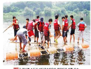
영동군 양산면 수두리 비단강소마을의 뗏목타기 체험 모습.

영동군에서는 하안면 지내리 금강모지마을과 하안면 도우리 시장골마을, 양산면 수두리 비단강소마을 등 3개마을이 여름휴가 페스티벌에 참가한다. 이들 마을은 이번 행사에서 대표적인 체험프로그램을 소개하고 농·특산물을 홍보해 도시민들이 고향의 정취를 한껏 느끼게 할 계획이다. 금강모지마을은 포도 참관 및 딸기, 대나무 뿔쏘기, 앞공예품 만들기 등 체험프로그램과 영동의 대표적인 과일로 만든 외인울 소개한다. 포고버섯 폐목으로 장수풍영이와 사슴발레를 길러 풍영이 마을