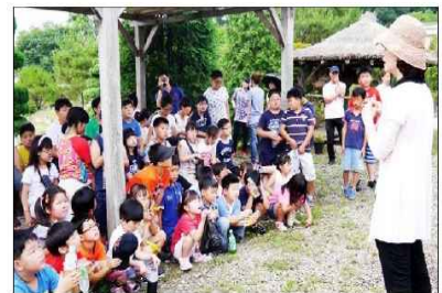
영동 양산초는 지난 22일 전교생을 대상으로 청의적체험활동을 펼쳤다.

영동 양산초등학교 전교생들은 지난 22일 청의적체험활동으로 조선 고종황제 때 정3품의 벼슬에 올라 시종관으로서 어의를 지낸 변석홍 응의 생가인 제월당을 찾아 제월당의 역사와 전통적의 현장을 둘러보고, 자연과 인간의 관계에 대해 다시 한 번 생각해보는 소중한 시간을 가졌다. 매일 1회 학교단위 청의-체험활동의 일환으로 펼쳐지고 있는 공감여행은 지역의 문화와 자연유산을 찾아 지속가능한 문화로 남을 수 있도록 공감대를 심어주는 데 목적이 있다.