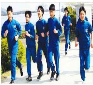
학교법인 일곡학과 기교이 42년째 학원 전통으로 내려오고 있는 5km 마라톤 행사를 진행하고 있는 모습.