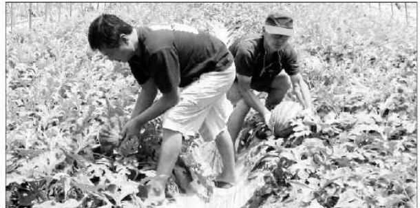
영동군 양산면 송호리 일원 수박시설하우스 단지에서 최고의 당도를 자랑하는 ‘양산수박’ 출하가 한창이다.

수박 주산지인 송호리 마을은 오는 7월 중순까지 수박 수확을 끝내고, 곧바로 시설하우스에 당근을 파종해 연2기작으로 농사를 짓는다. 이 마을은 사질토양으로 물 빠짐이 좋아 수박과 당근 재배의 적지로 인정받고 있다. 그러나 수박재배 연작으로 인한 피해가 나타나자, 이 마을 수박농가들