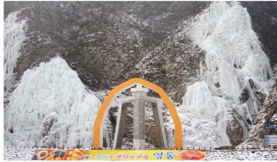
7일부터 개장하는 영동군 용산면 울리 '영동빙벽장'.