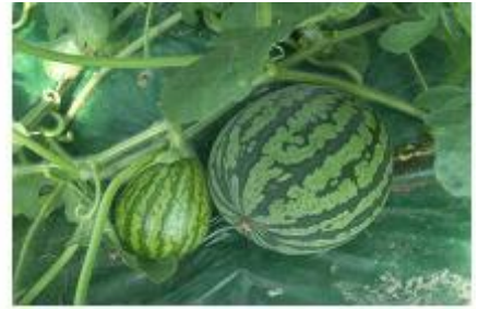
<저온으로 수박 생육 불균형>