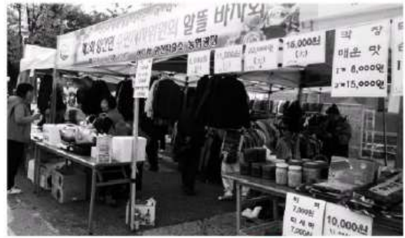
영동 양산면자치위, 알뜰 바자회 영동군 양산면주민자치 위원회(위원장 장필호) 가 2일 오전 10시부터 오후 5시까지 학산농협양산지소 앞에서 불우 이웃돕기 기금 마련을 위한 알뜰 바자회를 열었다.