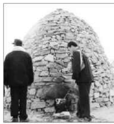
봉수대 재현 모습.

주요 행사로는 봉수대탐방, 땃목타기, 물고기잡기, 손두부 과일잼 꽃감만들기, 떡메치기 등을 비롯해 널뛰기, 투호던지기, 연날리기 등 민속놀이와 2인용 자전거타기, 짚공예 등 다