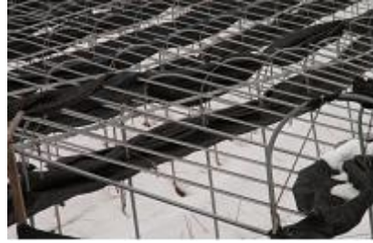
<인삼시설 차광망 제거>