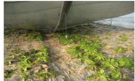
<하우스 붕괴로 시설작물 피해>

☞ 시설하우스 설계기준 이상의 폭설로 하우스 붕괴 또는 파손시 시설작물 저온피해가 발생할 수 있으며, 생육적온 이하의 저온 경과시 생육 부진과 시설하우스 내부 과습으로 인한 병 발생 및 습해 우려