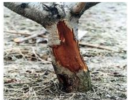
<동해피해로 지체부 갈변>