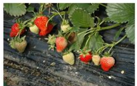
< 기형과 발생 및 병해충 증가 >