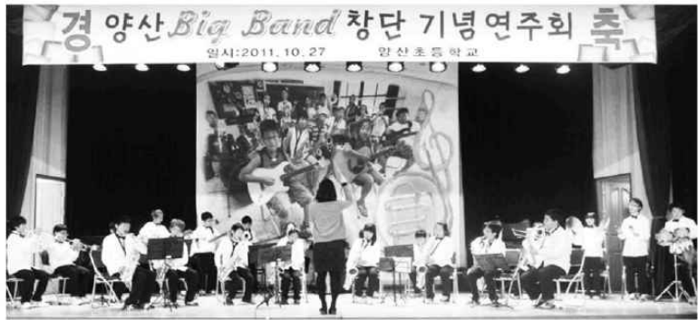
지난 6월 창단에 맹연습해 온 양산초교 '빅밴드'가 지난 27일 지역주민들을 초청해 창단기념연주회를 갖고 있다.

충북도교육청으로부터 2500만원의 방과후 사업비를 지원 받은 학교는 악기를 구입하고 단원을 가르칠 강사도 2명 확보했다.