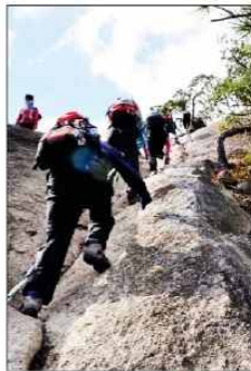
충북의 설악이라 불리는 영동 천태 산에서 늦가을 산행을 즐기려는 등 산객들의 발길이 크게 늘고 있다.