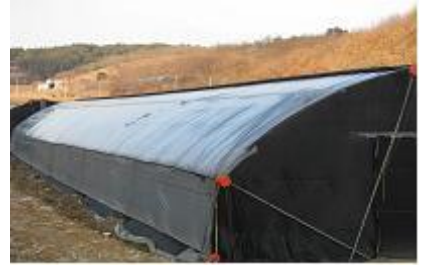
<차광망 위에 비닐을 씌움>