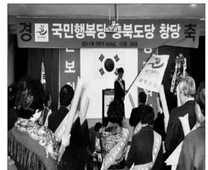
가칭 국민행복당 충북도당이 28일 영동군 문화원에서 당원 500여명이 참석한 가운데 창당식을 가졌다.

“인보를 생각하고 침묵하는 다수의 국민들을 위해 길 걸을 재시해주시라”며 국민행복당이 김라경이