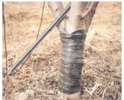
<주간부 수성페인트 도포> <주간부 보온단열재 피복> <피해시 과열부위 벤딩처리>