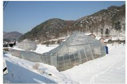
< 폭설로 시설하우스 붕괴 >

☞ 시설하우스는 설계기준 이상의 대설시 과다 하중으로 인한 붕괴 또는 파손이 발생되며, 하우스 위에 쌓인 눈이 있는 상태에서 강풍시 설계기준 이하에서도 피해가 발생할 우려