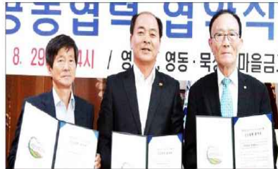
영동군은 새마을금고와 '지역희망공헌사업' 협약을 체결했다.

망공헌사업 영동군협의회'는 ▲준도리 쌀 나누기 ▲사랑의 김장나누기 등 취약계층을 보호하고, 지역경제 활성화를 위해 ▲전통시장 지원 ▲지역 특산물 판매 유통 지원 ▲마을기업 지원 등 다양한 사업을 추진하게 된다.