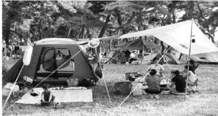
빼어난 절경을 자랑하는 송호국민관광지가 휴가철을 맞아 캠핑을 즐기려는 방문객들로 북적이고 있다.

특히 이곳에서는 물고기 잡기 등을 체험할 수 있을 뿐만 아니라 인근에 조성돼 있는 체