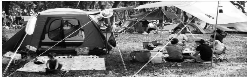
영동군 양산면 송호리에 위치한 송호국민관광지 야영장이 휴가철을 맞아 아이들과 함께 오토캠핑 대신 아날로그 캠핑을 하며, 추억을 만들려는 가족단위의 캠핑족들로 북적이고 있다.

야영장 내에 캠핑객 편의를 위해 화장실, 급수대, 샤워장, 취사장 등의 기본적인 시설이 갖춰져 있어 야영하는데 불편함이 없다.