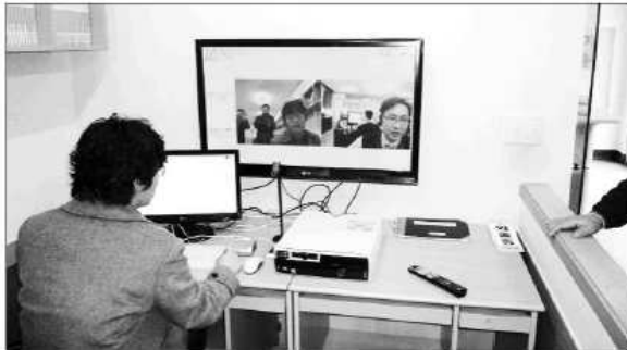
보은군이 다문화가정들의 빠른 생활정착과 모국 가족들과의 수시 화상상봉을 위해 '다문화 가정 화상상봉 시스템'을 구축했다. 사진은 시험동화하는 모습.