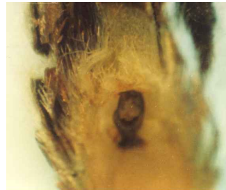
<동해 피해 꽃눈>