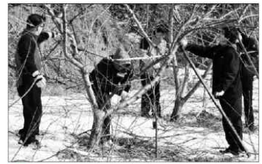
영동군이 과수농가 꽃매미 피해를 최소화 하기 위해 방제대책을 수립, 예찰반을 운영한다.