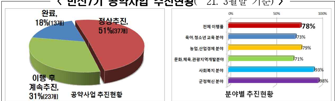
〈 민선7기 공약사업 추진현황( '21. 3월말 기준) 〉