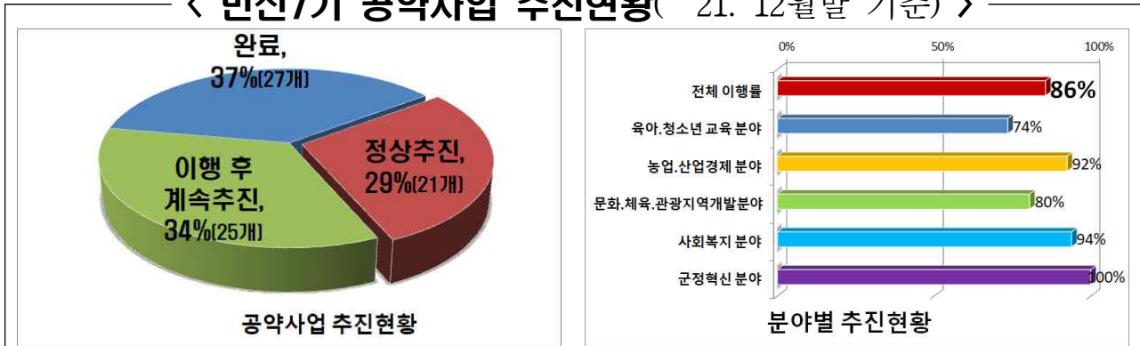
〈 민선7기 공약사업 추진현황( '21. 12월말 기준) 〉